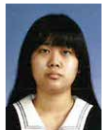
古河第二高等学校

祖父は祖母と息子の三人で暮らしている。でも、二人はあまり認知症に理解が無いようで、祖父を責めるような口調になってしまっていることが多かった。そんな時、祖父はとても悲しそうな顔をしていた。それを見ているのはとても苦しかった。辛かった、悲しかった。声をかけたいと思つたが、普段関わらない私が声をかけてしまつていいのか分からなくて声をかけられなかったが、その後私が話しかけた時、祖父の声のトーンが明るくなった気がして、表情も前より明るくなった