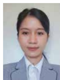
特別養護老人ホーム アクティブハートさかど

私はミャンマーからの実習生です。面接のため介護の知識をインターネットで検索しました。高齢者や障害者等に対する介護に関し、県民への啓発を重点的に実施するための「介護の日」である11月11日を、「いい日、いい日」と簡単に覚えめました。面接後、介護センターに介護の知識と技術をつけて習いました。それからもっとも面白くなりました。自分が分かる介護はおじいさんとおばあさんへの介助だけです。今、だんだん分かってきたのは利用者の尊厳のある暮らしを支える専門の仕事です。出来る事は自分でやってみたら人間らしく喜びを感じて生きられるように自立支援をすることです。今、勤めている会社の理念は「人生をより楽しく元気で」～あたたかくもっとあたたかく～です。あたたかい思いやりが職員さん同士にも、利用者さんに接する為にも重要なポイントだから気になって好きな事でした。私の職場は利用者さん10名様が入居して、「ひかり」というユニットです。家のような部屋でございますから