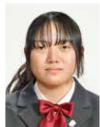
大成女子高等学校

今だから気づくこと―それは、介護される側だけでなく、する側のケアも大切ということです。祖父と祖母が、ひいおばあちゃんを連れてうちに遊びに来てくれた時、目の前にあるコップパンを布巾だと思いついてしまいがち、パンでテーブルを拭いてしまったことがあります。その時、祖父が注意しながらパンを取り上げようとしたのですが、意思の疎通が取れず、大きな声で叱ったことがあ