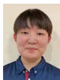
特別養護老人ホーム セ・シボンかしま

介護の世界に入って、今年で2年目になります。小学生の時に、自分が思っていた事だけでは