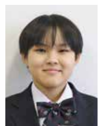
古河市立三和北中学校

また、介護をする人の負担を少しでも減らすために介護保険制度があり、デイサービスや介護施設も多くある中、家族が選択することができ、介