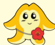
茨城県老協 マスコットキャラクター ローシー

2018年11月11日「介護の日」に生まれる 介護の「介」をモチーフにしている 頭の形は「筑波山」 目は国道6号線（ロココク）の「6」 体はメロン生産量日本一にちなみ「メロンパン柄」