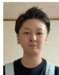
特別養護老人ホーム愛和苑

介護職に就き十七年が経ちました。介護職を選んだきっかけはお年寄りが好きだからとかではなく、安易な考えでした。高校三年生の就職活動中、担任から何がやりたいのか？と聞かれた際にやりたい事もなく、やりがいがある事をしたいと伝え、紹介されたのが介護でした。まさか、自分が介護士？と思ってもいなかったので驚きました。いざ就職し、介護職として働き始めましたが、色々な壁にぶつかりました。始めは知識も技術もなく、目上の方に対する言葉遣い、人のお世話をする事の難しさ、社会人としてのマナーも分からず四苦八苦していました。まったく上手くいかず、何度も挫折をし、仕事に行きたくない。辞めたい。と思うようになってしまった事もありました。あと何時間で出勤出来る。そんな事ばかり考えていたある日、一人の入居者様が声を掛けてくれました。その入居者様の一言で自分自身の考え方が大きく変わりました。「いつもありがとうございます」その言葉でした。自分は誰の為に、何の為に介護職を選