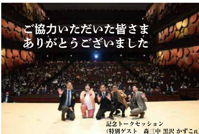
記念トークセッション (特別ゲスト 森三中 黒沢 かずこ氏)