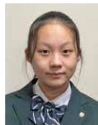
江戸川学園取手高等学校

祖母の介護の経験を生かし、将来両親に介護が必要になった際、背を向けるのではなく少しでも快適な暮らしに近づけるようにサポートしていきたいと思う。