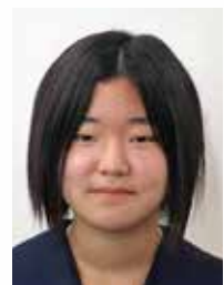
銚田市立旭中学校

私の兄は障害をもっているため、ほとんど介護が必要な生活を送っています。移動は車いす、食事は一日五〜六回、胃から注入する胃ろうという食事法で、排せつもオムツを使用しています。主に母が介護や介助をしています。私も毎日その姿を見て、母と一緒に兄の介護の手伝いをすることもあります。家の中では兄が生活しやすいように、介護もしやすい室内ですが、一歩外へ出る