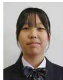
古河市立三和北中学校

そんな私ですが、心の中で老人ホームのような知らない人と関わりや交流を増やすところでは負担が掛らないのかと疑問に思っていました。その疑問を抱きながら一日だけ母が働いている老人ホームに連れて行ってもらったことがあります。中に入ってみると、気持ち明るくなるようなポスターや色画用紙で作られた絵がたくさん壁にはってありました。利用者さんたちはぬり絵や工作、グループでのゲームをしていました。利用者さんたちの笑顔を見て、交流を増やすことは少しも負担に思っていないと感じました。父や母の家の姿を思い返すとよく会社からストローや色画用紙、輪ゴムなどを持ち返ってきていました。そのことが気になったので実際に母に聞いたことが